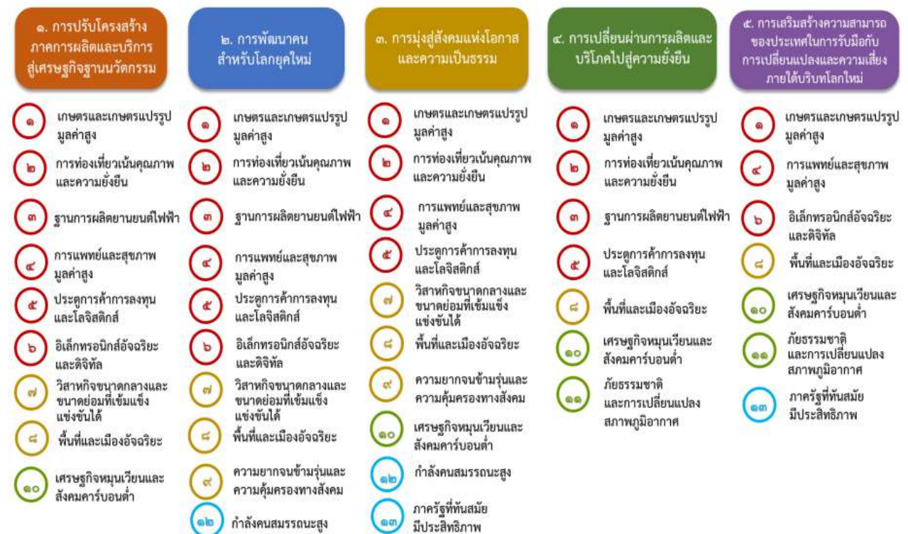
แผนภาพที่ ๓.๑ ความเชื่อมโยงระหว่างหมวดหมู่การพัฒนากับเป้าหมายหลัก

ความเชื่อมโยงระหว่างหมวดหมู่การพัฒนากับเป้าหมายหลักแสดงไว้ในแผนภาพที่ ๓.๑ โดยหมวดหมู่ การพัฒนาที่กำหนดขึ้นเป็นประเด็นที่มีลักษณะเชิงบูรณาการที่ครอบคลุมการพัฒนาตั้งแต่ในระดับต้นน้ำจนถึง ปลายน้ำ และสามารถนำไปสู่ผลพัฒนาทั้งในมิติเศรษฐกิจ สังคม ทรัพยากรธรรมชาติและสิ่งแวดล้อมไปพร้อมๆ กัน ทำให้หมวดหมู่แต่ละประการสามารถสนับสนุนเป้าหมายหลักได้มากกว่าหนึ่งข้อ นอกจากนี้การพัฒนาภายใต้ แต่ละหมวดหมู่ไม่ได้แยกขาดจากกัน แต่มีการสนับสนุนหรือเอื้อประโยชน์ซึ่งกันและกัน