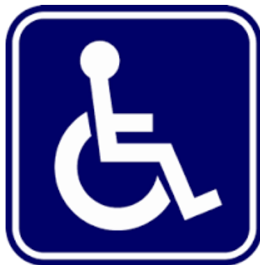
สัญลักษณ์ผู้พิการ