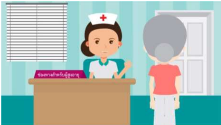
ช่องทางเฉพาะสำหรับผู้สูงอายุ

ผู้สูงอายุได้รับการจัดช่องทางพิเศษเฉพาะเพื่อให้ผู้สูงอายุได้รับการบริการที่สะดวก รวดเร็ว