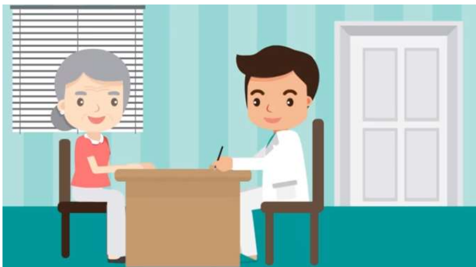
คลินิกสำหรับผู้สูงอายุ